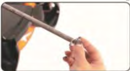
9. Usuń podkładkę tylnej osi.