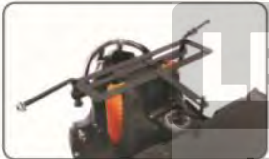
2. Zainstaluj ramę.