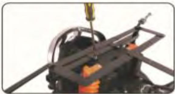
3. Przymocuj ramę śrubkami.