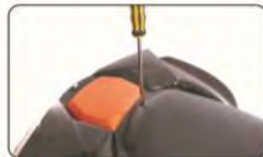
16. Przykręć śrubki