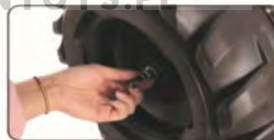
6. Przykręć podkładkę z nakrętką.