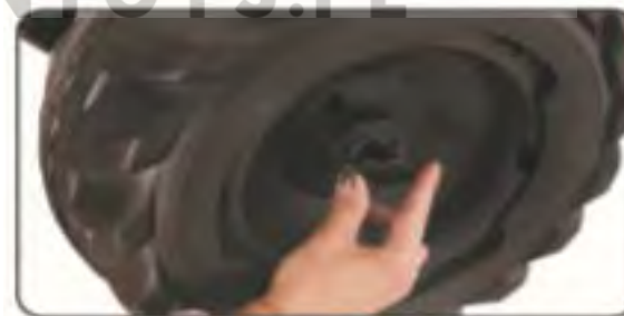
12. Przykręć śruby.