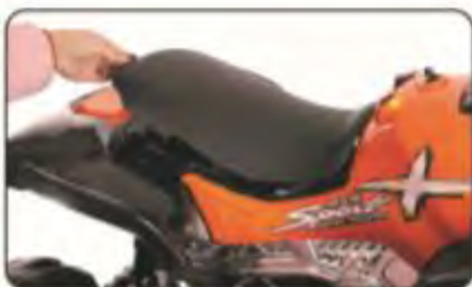
15. Zamontuj siedzenie.