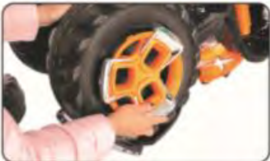
13. Zamontuj kołpak