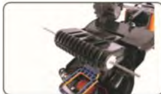
10. Wyceluj i przeprowadź śrubkę na koła.