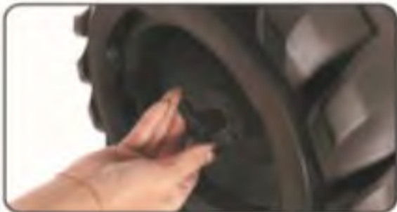
7. Przykręć śruby.