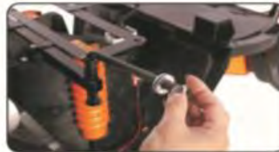
4. Poluzuj nakrętkę.