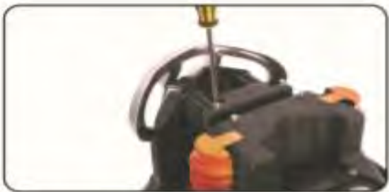
1. Poluzuj śrubki.