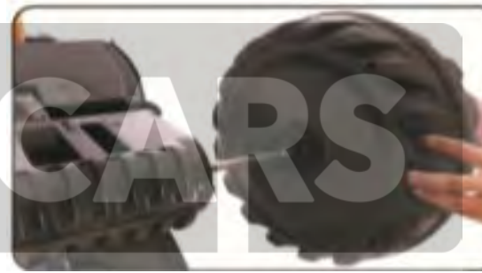
11. Zainstaluj tylnie koło.